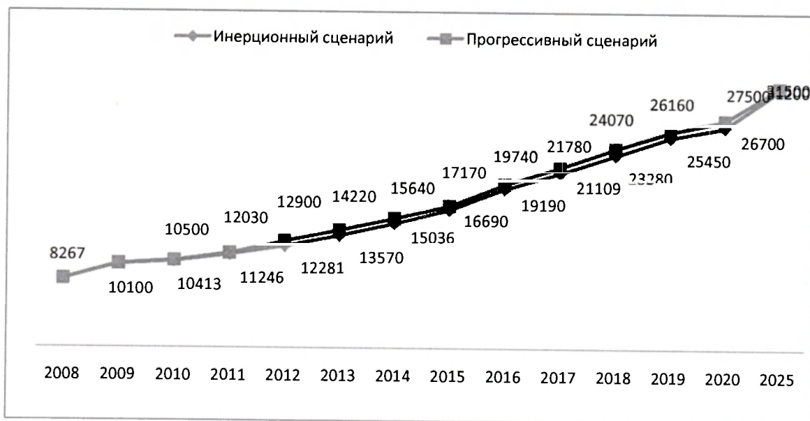
Рис. 13. Прогноз роста среднемесячной заработной платы (рублей)

•Увеличить объем консолидированных налоговых и неналоговых поступлений с 82 млн. рублей до 277 млн. рублей и изменить их структуру.