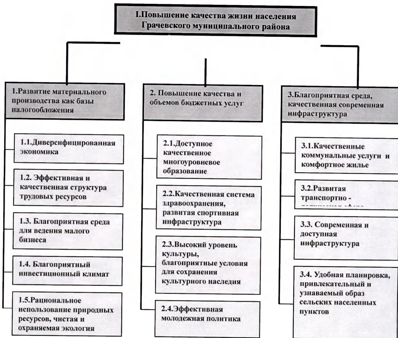
Рис.14. Стратегические цели и ключевые направления деятельности администрации Грачевского муниципального района.